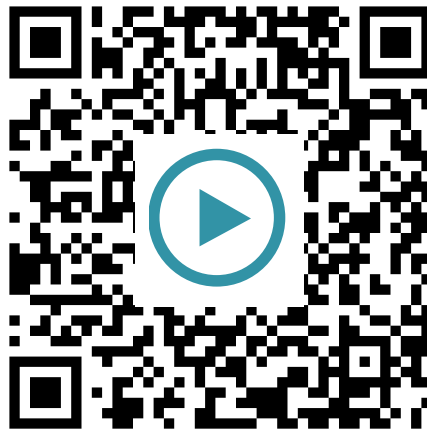
Knochenbruch beim Pokalspiel

Wie viele Knochen hat ein menschliches Skelett ungefähr?